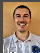
GUIDA A CURA DI ADOLFO NOVELLO

(ATTENZIONE: PER I PROCESSORE APPLE SILICON M1 AD OGGI, 02/2021, NON E' ANCORA POSSIBILE)